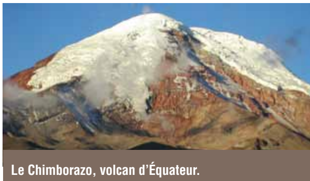
Le Chimborazo, volcan d'Équateur.