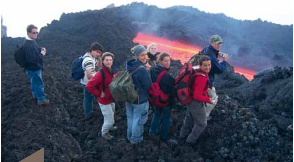
Un groupe d'élèves à l'Etna.