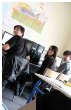
L'équipe au travail.

Chaque année, depuis 2007, l'AAPG lance son concours international IBA avec un jury constitué d'experts mondiaux de l'industrie pétrolière 2 . Chacune des équipes constituées d'étudiants de niveau master d'universités ou d'écoles d'ingénieurs se voit remettre un set de données déterminant une zone géographique du globe à étudier et dont tout le potentiel d'exploitation n'a pas encore été dévoilé. Elles ont deux mois pour faire l'étude sur données réelles de la zone pétrolière qui leur a été attribuée et en proposer une évaluation. Chaque équipe soutient ensuite son projet à l'oral devant le jury et les équipes concurrentes.