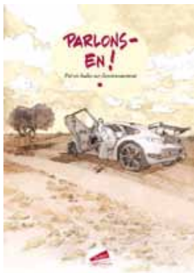
Couverture de la bande dessinée.