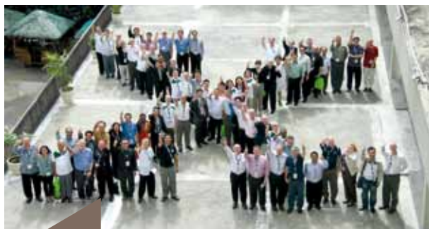
Les représentants des universités LaSalle.

directeur du marketing et de la communication