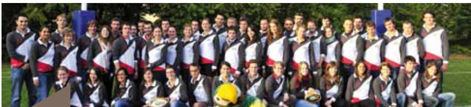
L'équipe de la XVIII e édition des Ovalies.