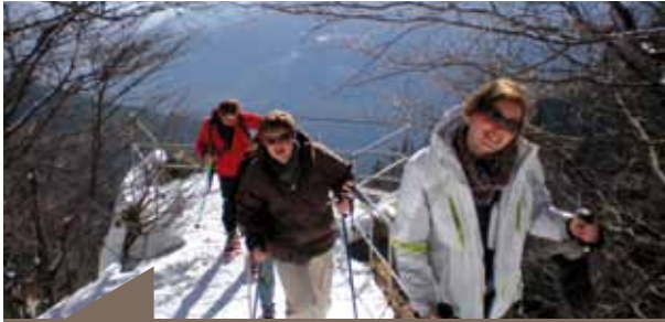
Trois des 149 en pleine ascension du col.

En point final de ce week-end chargé : une tartiflette réalisée au Munster, à la sauce locale, arrosée d'un peu de vin alsacien. Une grande réussite pour cette recette régionale.