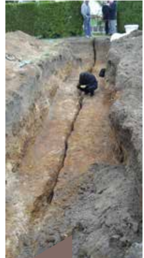
Étude d'une crevasse à Cocheren (57).