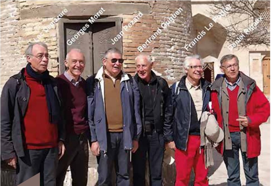
Nos Alumni (Agriculture, 1967), heureux de ces retrouvailles.