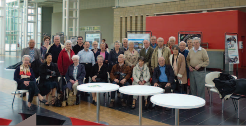
La promotion Agriculture 1953 réunie dans l'Agora.