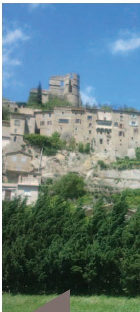
Montbrun-les-Bains, classé parmi les plus beaux villages de France.

C'était une première pour l'Institut : un voyage de presse organisé sur le terrain avec les géologues.