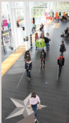
Journée Handivalides dans l'Agora.

La mission handicap, soutenue par des associations comme Hanploi ou la FÉDÉEH, aide aussi les étudiants handicapés à trouver des stages, contrats d'apprentissage ou des emplois.