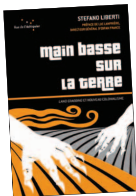
Main basse sur la terre, Stefano LIBERTI Ed. Rue de l'échiquier.

Qu'on l'étudie au-dessus ou en dessous, la terre est la matière fédératrice et le fil rouge de tous les étudiants et ingénieurs de LaSalle Beauvais. C'est aussi depuis quelques années un enjeu économique et géopolitique majeur. Les hommes se sont toujours battus pour quelques arpents de terre... mais aujourd'hui c'est en centaines de milliers d'hectares que se mesurent les enjeux.