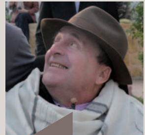
Philippe POZZO DI BORGO, ayant inspiré l'histoire du film Intouchables .

« Nous pouvons vivre réconciliés avec nos fragilités. » C'est la première observation partagée par Philippe POZZO DI BORGO dans la vidéo enregistrée spécialement pour l'événement. « Dans le handicap, on trouve le silence. Vous aussi posez-vous, faites silence » , conseille cet ancien hyperactif, assoiffé de sports extrêmes. « Arrêtez de vous projeter dans l'avenir : occupez le moment » , conseille-t-il aux plus jeunes de l'assemblée, en se remémorant son besoin autrefois d'être « l'acteur principal de sa vie, en se faisant immortel. » « Aujourd'hui, je suis fragile, et je retrouve le respect de ma condition humaine en toute simplicité, en toute frugalité. Je deviens plus patient. » À plusieurs reprises, Philippe POZZO DI BORGO rappelle la définition de « considération : action d'examiner avec attention » . Pour lui, la considération est la solution de la nouvelle génération. « En consacrant du temps à l'infiniment petit, j'ai appris à me décentrer de moi, à considérer l'autre dans ses différences. » Cette expérience, il souhaite la partager : « soyez contaminés par le virus de la considération, disséminez-vous ensuite dans le monde. » Il conclut par ces mots : « soyez touchés par la grâce de la fragilité, les différences sont porteuses de tant de richesses. »